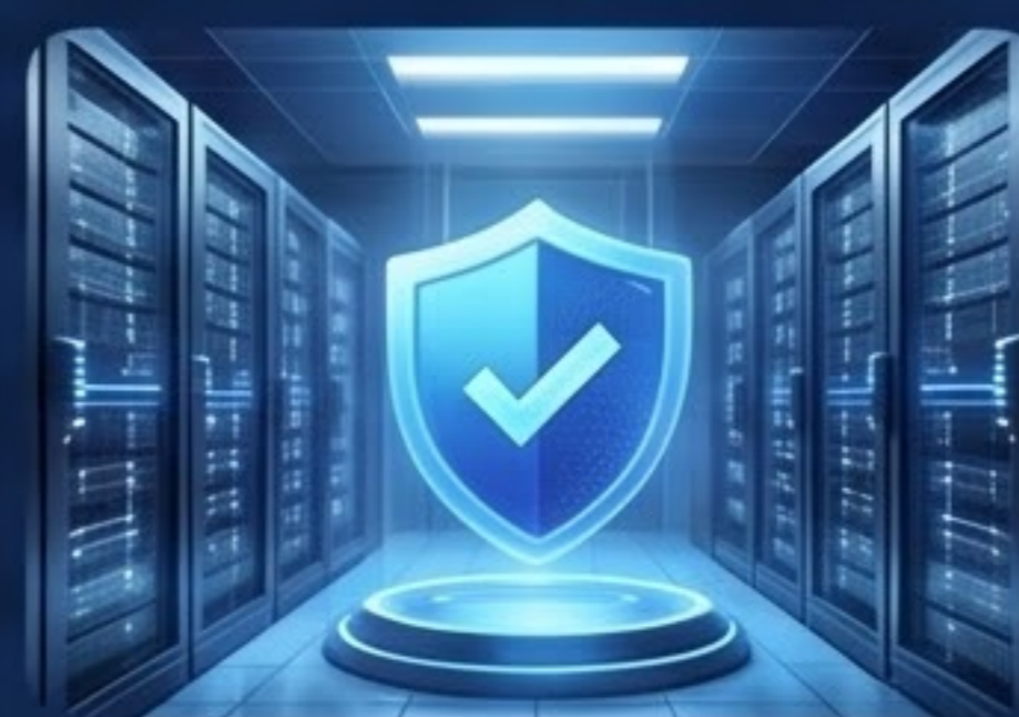
中国裁判所 (司法車網) セキュアAI配備