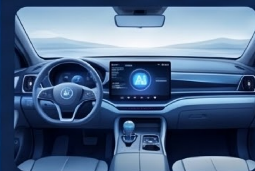
長安マツダ, 吉利智己 スマートコックピット